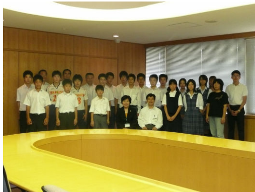
〈市長・教育長と出場選手の皆さん〉