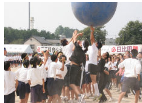
〈昨年の柳瀬地区(大玉おくり競争)〉