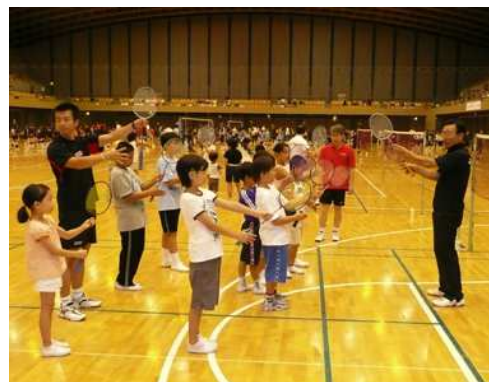
(イベントの様子：所沢市民体育館)

PR活動としては、各自治会を通して回覧などで、また、10月号「広報とこざわ」でも詳細をお知らせします。