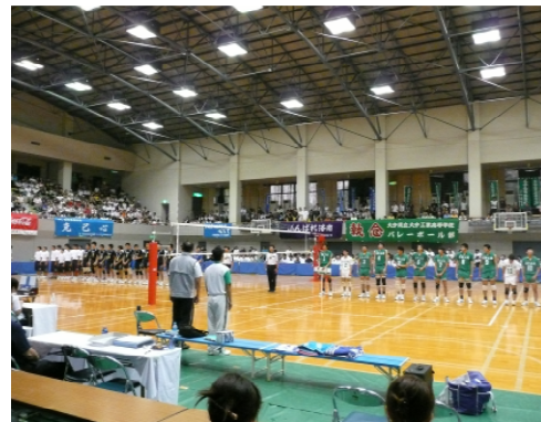
(今年度佐賀大会の様子)

来年7月28日から8月10日までの期間内に選手、役員、観客等約6万人が訪れますので所沢市実行委員会を組織して、その準備に万全を期しています。