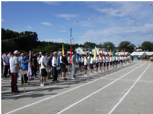
(選手整列しての開会式)

とかく疎遠になりがちな中学生と協働して行う事業としての体育祭も回を重ねること6回を迎えました。お蔭様で地域と学校が一体となって、前日の準備としてのテント設営や万国旗張り、ライン引き、後片付けなど順調に行うことができました。