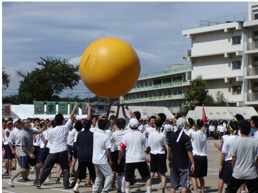
(中学生・支部合同の大玉おくり)

とかく疎遠になりがちな中学生と協働して行う事業としての体育祭も回を重ねること6回を迎えました。お蔭様で地域と学校が一体となって、前日の準備としてのテント設営や万国旗張り、ライン引き、後片付けなど順調に行うことができました。