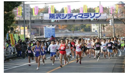
▲昨年の大会の様子