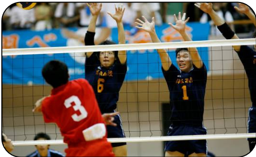
▲昨年の佐賀大会の様子

インターハイは、県内各地で全29競技が行われ、所沢市は、バドミントン男女・男子バレーボールが行われます。