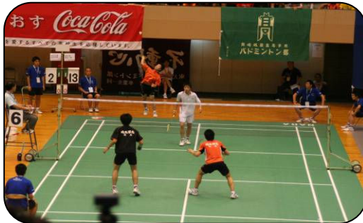
▲昨年の佐賀大会の様子

7月29日(火) 学校対抗1～3回戦 7月31日(木) ダブルス1回戦～準々決勝 8月1日(金) シングルス1回戦～準々決勝